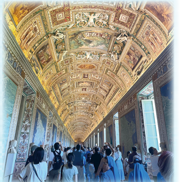
▲圖8：梵蒂岡博物館內40幅地圖長廊 窖保留古羅馬糧倉及遺跡，正門外有古羅馬文化留下的「真理之口」誠實與真相象徵，大家都搶著拍照留念（圖14）。