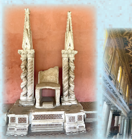
▲圖4：拉特朗大殿小花園5世紀教宗石椅