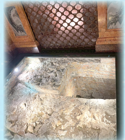
▲圖11：聖保祿大殿聖保祿墓的遺址