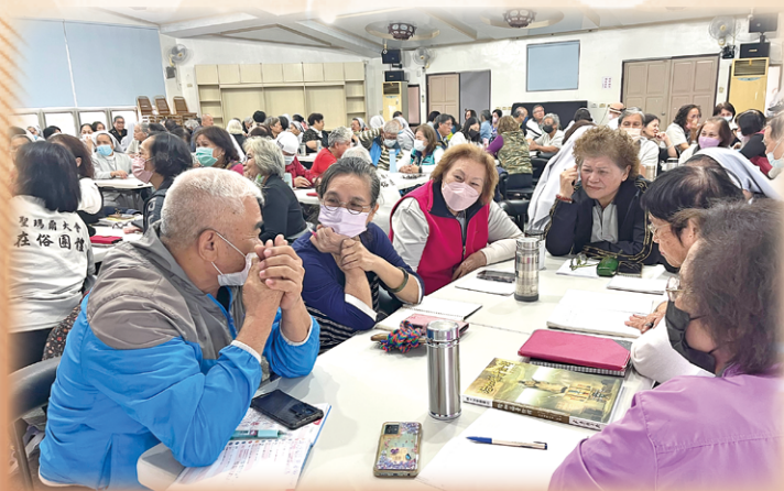
▲11月3日的研習會在花蓮保祿牧靈中心舉行，吸引了百餘人踴躍參與，盛況空前。

因為，從《創世紀》天主創造宇宙萬物開始到《默世錄》，即使其間人類的貪婪破壞世界，天主總是不斷透過不同的人，陪伴世界走向美好，因此，希望聖神繼續激發我們先知性的想像，讓我們成為正義與和平的使者。