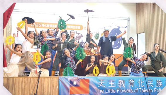
▲瑞芳樂舞四部曲，今年帶來的是金瓜石礦工舞，舞者模仿礦工堅毅的神情，更展現在地的特色與生命力。

戴立林神父來台時，只帶著一本《聖經》與一顆願意愛人的心。他把青春放在山城、奉獻放在偏鄉，將一生最美的風景留給了瑞芳。他用雙手接住孩子的夢，用舞蹈搭建偏鄉與世界的橋梁，用生命書寫了一首最溫柔的詩。如今育化在某個舞台角落，用舞步延續那份來自遠方比利時的愛。