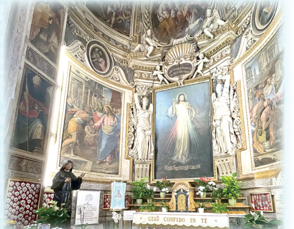
▲圖7：在聖神堂舉行耶穌慈悲敬禮的左右兩旁，有許多votum還願小聖心。