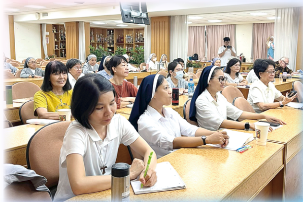
▲10月13日在道明中學文藻樓高雄場，與會者在聖神的引領下聚精會神。