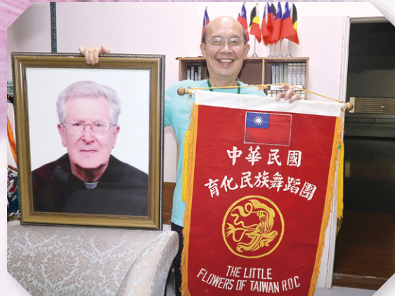
▲感念戴神父為瑞芳的大愛奉獻，戴立林神父的遺像、育化民族舞蹈團團旗與木頭老師合影。

2005年底，無數的教友與小花們哭紅了眼，戴神父回歸主懷，長眠於台灣土地。他留給瑞芳的，不是財富，而是文化、教育與愛。為了延續他的心願，團員與教友成立財團法人戴立林文化藝術基金會，宗旨是保存育化的歷史，並持續照顧弱勢與偏鄉兒童。在第一代團員蘇維文董事長長期、持續努力下，基金會每年舉辦「育化藝術夏令營」，孩子們在營隊中學舞蹈、學紀律、學分享，也持續走訪安養院、醫院，用舞蹈傳遞關懷。正如維文姊妹所說：「這些努力，都像無形的燈，照亮每一