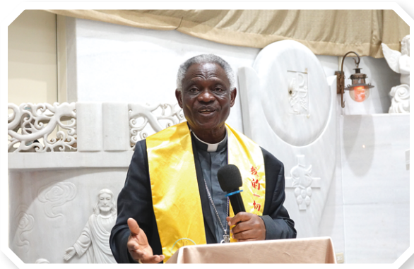
▲涂克森樞機親切鼓勵移民移工時時懷抱希望

求所想的一切並永遠作你們的力量。也願瓜達盧貝聖母與聖卡洛·阿庫蒂斯在『希望朝聖者禧年』中時常為你們轉求。願天主常降福你們。」接著由聖采琪聯合弦樂團以悠揚樂音迎接樞機，從磅礴曲目到溫柔空靈的〈聖母頌〉，皆讓人心靈沈靜、舒緩身心，為這場充滿信仰與感恩共融的相聚畫下溫馨而莊嚴的結尾。