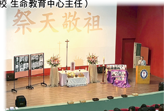
▲聖母醫護管理專科學校舉辦祭天敬祖禮，提醒眾人感恩先人們的付出，更要跟隨與傳承他們留下的珍貴典範。友、恩人的祈禱單，並由各班班長代表奉獻給天主，以及放置在祖先牌位前。

隆重的獻香、獻花、獻果、獻酒，以及全體師生向祖先行禮致意，表達願承繼祖先的努力與滿滿的感謝。隨後，師生在思古幽情的國樂聲中，平靜地撰寫給已逝親