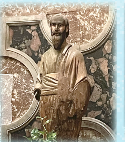
▲圖13：聖保祿像手臂被朝聖者刮掉