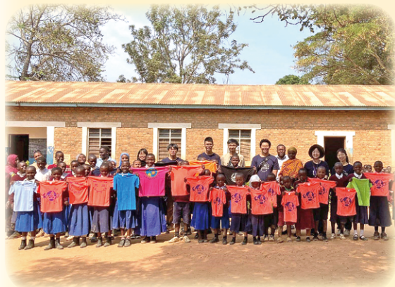
▲團隊前往Mahanje小學，捐贈來自台灣的文具與創家所提供的衣物，傳遞溫暖心意。

Asante sana——非常感謝，也謝謝一路支持與信任的每一份力量。願帶走的不只是足跡，而是一種將人放在心上的習慣；願留下的不只是一時的熱鬧，而是可以被在地延續的能力。在下一趟出發之前，我們會把這些學到的，變成更合宜的方式，再帶回那片土地，繼續把健康與教育落在每天的選擇裡。如今我們回到台灣，遠方依然黃塵翻滾，藍天高的不可思議，於是那片風景，早已在心裡留下不捨的牽引。