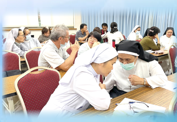
▲10月16日台北場在新店大坪林天下一家社教服務中心分組討論熱烈