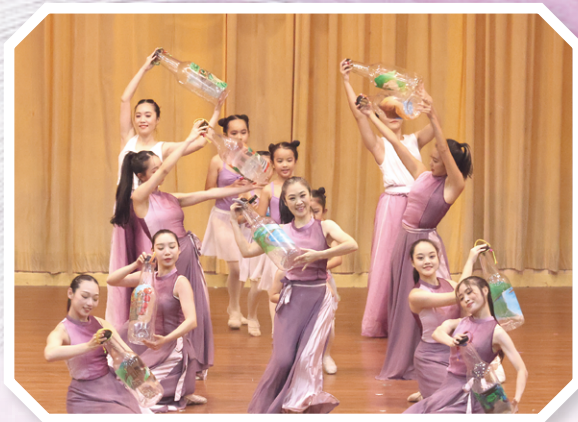
▲育化民族舞蹈團結合瑞芳瓶燈藝術文化，高舉手中的瓶燈，在幽暗寒冷的礦道裡，灑下溫暖與光明。

1973年，戴神父帶領瑞芳的8個孩子踏上歐洲巡演之旅。孩子們不懂英語，只會微笑與鞠躬。原本只安排2場演出，卻因為大受歡迎，臨時追加到50場，小花們領悟到舞蹈能跨越語言與膚色，讓世界為台灣瑞芳這個小山城響起掌聲。接下來的30年，戴神父與小花們的舞步跨越5大洲、