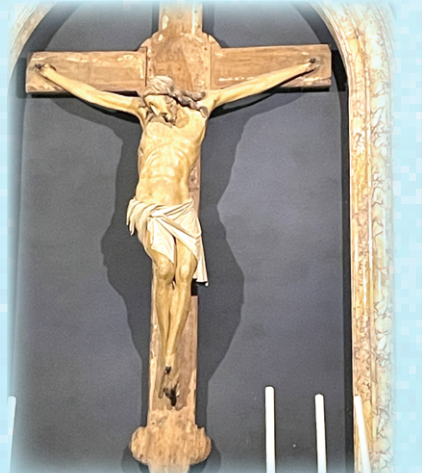
▲圖12：聖保祿大殿的顯現聖畢哲十字架