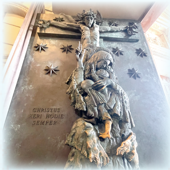
▲圖2：拉特朗大殿聖門