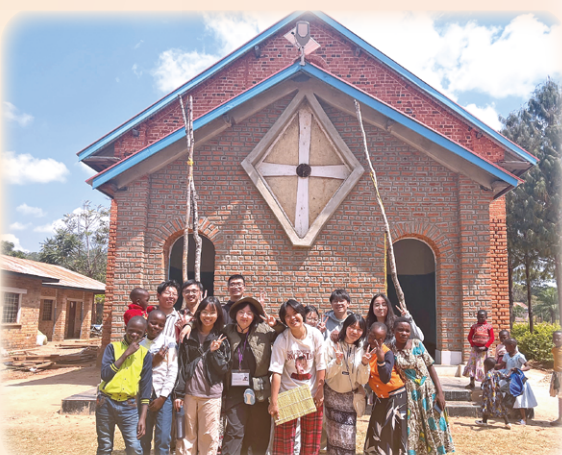
▲彌撒結束後在Mahanje教堂前大合照，團員手持當地樂器Kayamba，以竹管排列相連，裡頭隨節奏產生沙沙聲。