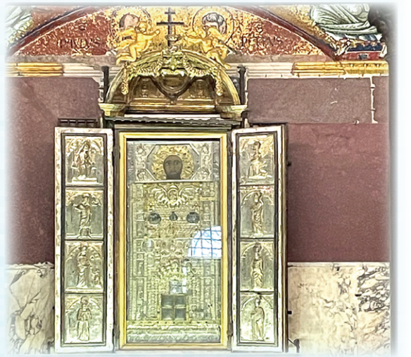
▲圖6：聖路加所畫的耶穌像