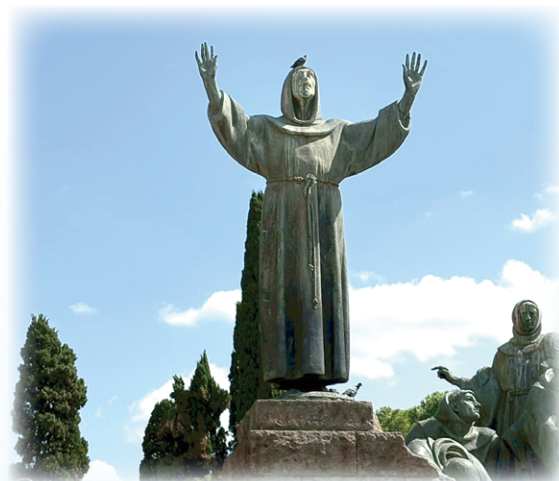
▲圖1：拉特朗大殿前的聖方濟像