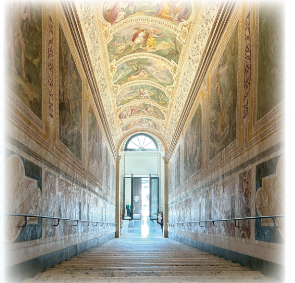
▲圖5：聖階堂的28階石階，相傳是主耶穌走過的。

隨後前往 希臘聖母堂及真理之口 。希臘聖母堂中世紀留下的拜占庭風格，可見到東方禮特有的聖幛（聖像屏）是行希臘禮教友的聖堂，歷史上也多次庇護從希臘逃避迫害來羅馬，請求教宗保護的東正教友。地下地