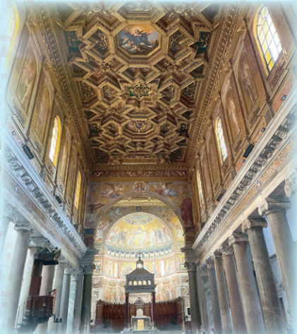
▲圖10：越台伯河聖母大殿