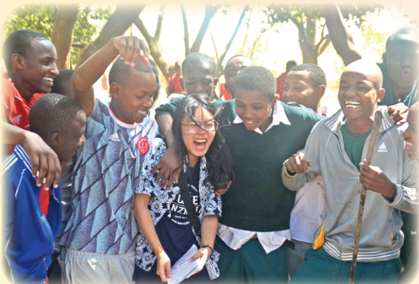
▲Oldonyo Lengai中學學生見到團員後非常開心，一起留下數張合影。