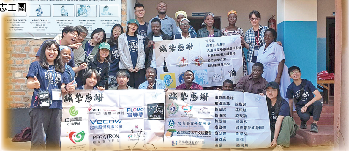
▲輔旦團成員與醫護人員及社區工作者在Mahanje診所合影留念

想到心的需要，團隊也透過線上心理衛生工作坊，回應憂鬱、焦慮與癲癇的去污名，在教師與家庭之間搭起辨識與轉介的路徑。同時辦理布衛生棉工作坊，講月經、談自我照顧，讓女孩的身體節律被理解在對話中被看見。走出教室，成員隨同修女進行家訪，補上當地資源的了解；也配合診所巡迴到較遠的村點，協助疫