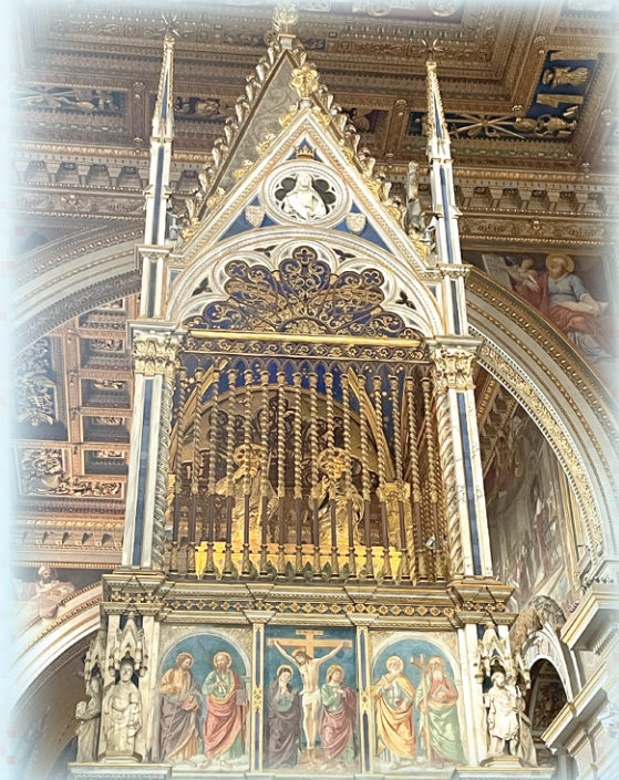
▲圖3：拉特朗大殿的聖伯多祿及聖保祿聖髑