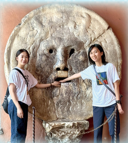
▲圖14：希臘聖母堂真理之口